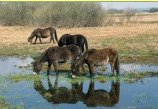
Exmoor-Ponys und Rinder verschiedener Rassen bewähren sich seit 1998 bei der ganzjährigen, sehr extensiven Beweidung des nassen Kernbereichs.

Folgende Maßnahmen sind zur Erreichung der Ziele geplant: