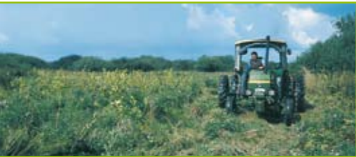
Streuwiesen werden gemäht, damit sie nicht mit Gehölzen zuwachsen. Zum Schutz der Wiesenbrüter erfolgt dies erst im Spätsommer oder Winter.