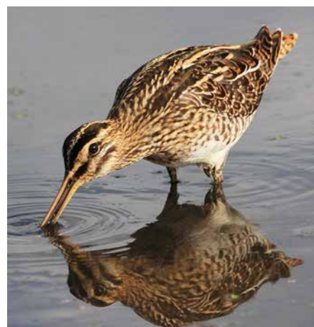
Bekassine bei der Nahrungssuche