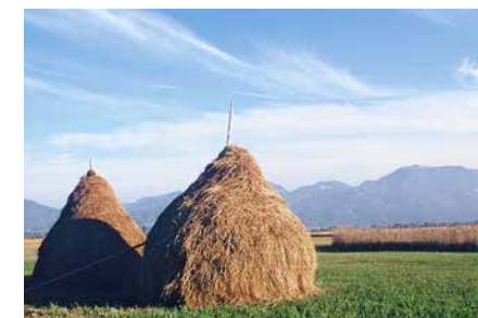
Streudrischen auf extensiv genutzten Wiesen