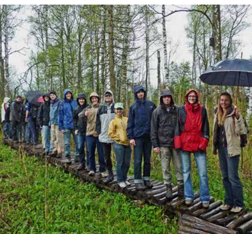
Auf Tour durchs Klosterland

Die Auswirkungen der Renaturierung des Klosterlands werden genau beobachtet, erforscht und dokumentiert – auch was deren Beitrag zum Klimaschutz angeht. Für das Management dieser Flächen verlieh der Landkreis Bad Tölz-Wolfratshausen dem ZUK den Umweltpreis 2005.