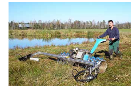
Eine Streuwiese wird gemäht und ...

wiesen überführt. Die Pflege wurde bis 2013 durch das vom Bayerischen Umweltministerium geförderte Modellprojekt „Landschaftspflegehof“ sichergestellt. Ziel des Projekts war, die großflächige Streuwiesenmahd so in landwirtschaftliche Stoff- und Wirtschaftskreisläufe einzubinden, dass sie langfristig rentabel ist. Die drei teilnehmenden Höfe führen das Projekt nun in eigener Regie weiter: Jeder Landwirt mäht pro Jahr etwa 30 Hektar Streuwiesen, um das Mähgut dann ganz traditionell als Einstreu in den Viehställen zu verwenden. Streu wird wieder gebraucht!