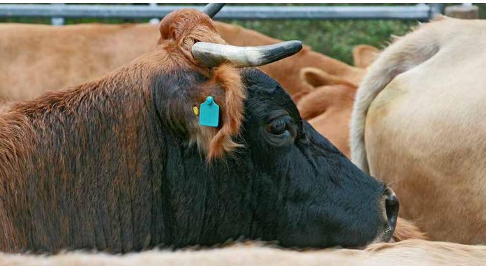
Murnau-Werdenfeler Kuh mit charakteristischer schwarzer Hornspitze

Das Beweidungsprojekt sichert damit nicht nur die hohe Artenvielfalt in der Pupplinger Au, es leistet einen nicht minder wichtigen Beitrag zur Erhaltung alter Nutztierassen und ist deshalb ein hervorragendes Beispiel für die Umsetzung der Bayerischen Biodiversitätsstrategie.