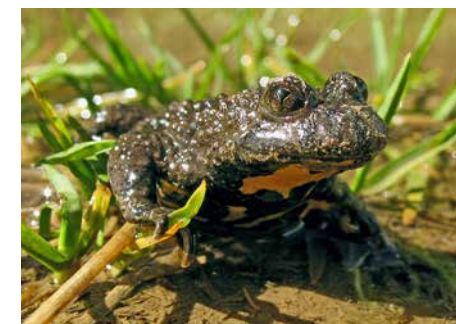
Gelbbauchunke: Geschützte Arten nach der FFH-Richtlinie