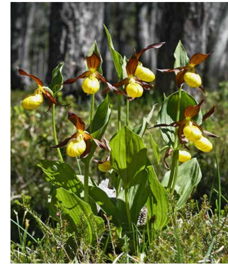
Unverkennbar – der Frauenschuh

Obwohl die Wälder im Unterwuchs stark vergrast und manche Arten bereits ausgestorben bzw. akut bedroht sind, hat sich hier eine außergewöhnliche Zahl seltener Pflanzen- und Tierarten erhalten können. In den letzten zehn Jahren konnten in der Isaraue über 300 Arten der Roten Listen bzw. Vorwarnlisten nachgewiesen werden – darunter mehr als 50 stark gefährdete oder vom Aussterben bedrohte Arten! Allein an diesen Zahlen verdeutlicht sich der unschätzbare Wert der Lebensräume in der Pupplinger und Ascholdinger Au für die Erhaltung der biologischen Vielfalt.