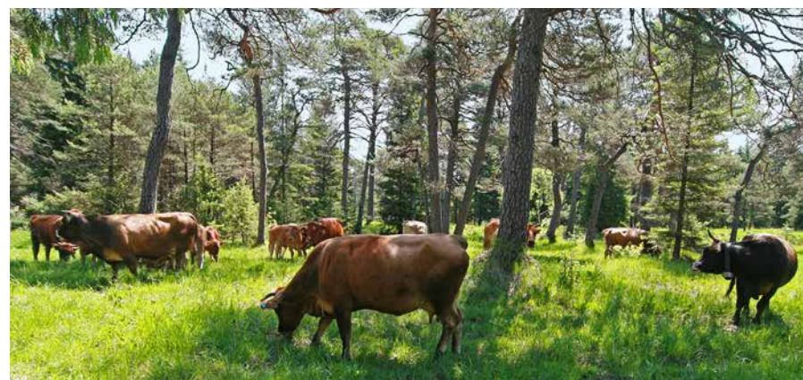
Seit 2010 grasen Murnau-Werdenfeller-Rinder in der Pupplinger Au