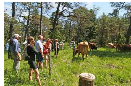
Die Führungen stoßen auf großes Interesse

notwendig – rechtzeitig Einfluss auf die Weideführung zu nehmen und Auftriebszeitpunkt oder Weidedauer anzupassen. Weitere Maßnahmen sind die Auflichtung verbuschter Bereiche oder die Mahd von Lichtungen mit weideempfindlichen Arten. Für Amphibien werden Kleingewässer geschaffen. An beliebten Plätzen wie der Pupplinger Au ist die Sensibilisierung der Erholungssuchenden eine weitere wichtige Aufgabe, die beispielsweise von den Isar-Rangern wahrgenommen wird. Entlang der Weideflächen informieren zudem Infotafeln, Faltblätter und Presseberichte sowie Führungen und Veranstaltungen zum Weideauf- oder abtrieb runden die Öffentlichkeitsarbeit ab.