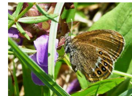
Wald-Wiesenvögelchen und ...

Kaum verwunderlich ist es daher, dass hier seltene Arten wie die Kreuzotter, die Gelbbauchunke oder das Wald-Wiesenvögelchen in großer Zahl vorkommen.