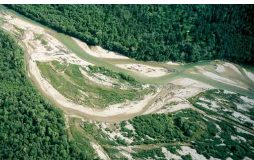
Die Pupplinger Au aus der Vogelperspektive

Doch die Natürlichkeit der Pupplinger und Ascholdinger Au ist trügerisch. Denn seit dem Bau des Sylvensteinspeichers sind die Hochwasserwellen seltener geworden und die Gestaltungskraft der Isar gemindert. Da zudem die früher praktizierte Streumahd und die Waldweide im letzten Jahrhundert weitgehend eingestellt wurden, setzte eine Verbrachung der Aue ein, die in Form einer dichten Decke aus Altgrasfilz den Fortbestand der Schneeheide-Kiefernwälder bedroht.